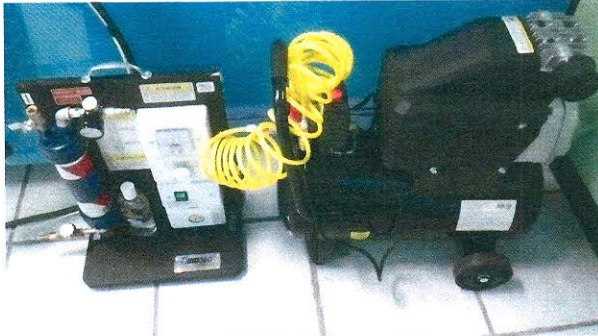
INYECTOR DE HUMO