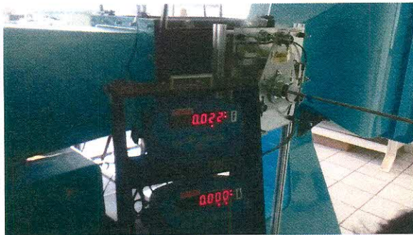
BALANZA ERODINÁMICA Y SISTEMA DE ADQUISICIÓN DE DATOS