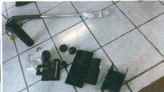
ACCESORIOS PARA TUNEL DE VIENTO